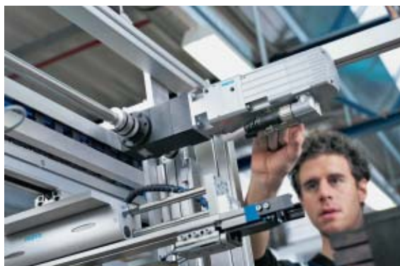
2 Un exemple de fabrication de machine

Le rôle de l'ingénierie de recherche est, comme son nom l'indique, de chercher : chercher de nouveaux produits, de nouveaux procédés, de nouvelles applications... Ces personnes travaillent au sein même de l'entreprise lorsqu'il s'agit de grosses structures faisant de la recherche en permanence, ou dans des bureaux de