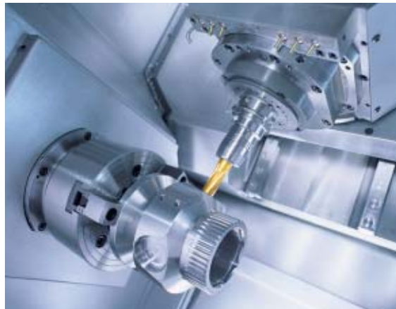
1 Usinage avec la GMX 200 de chez Linear

communication, mécanique, média, stage en entreprise